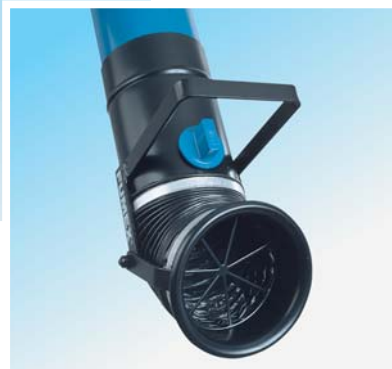
Sugdon med 360° svivel